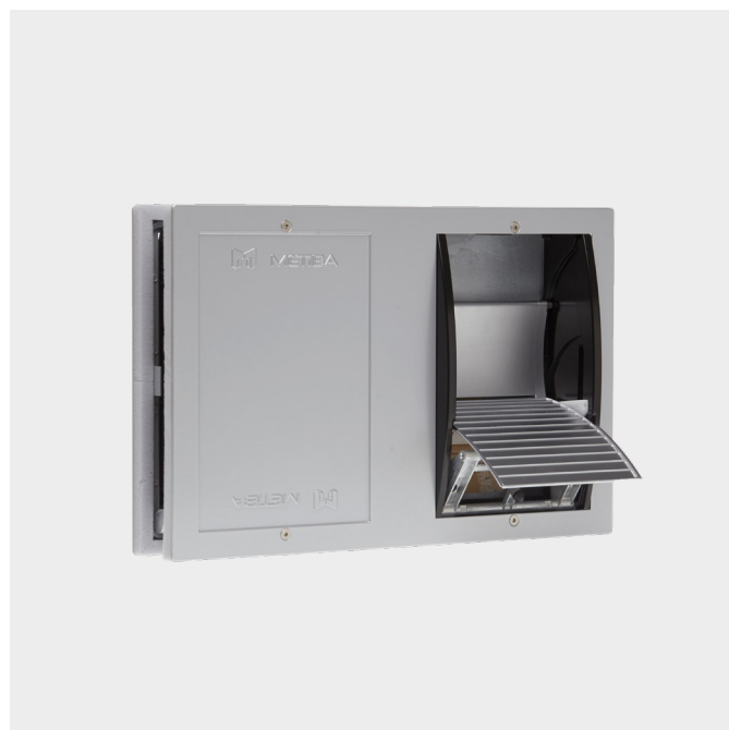
Pedal in heruntergedrücktem Zustand