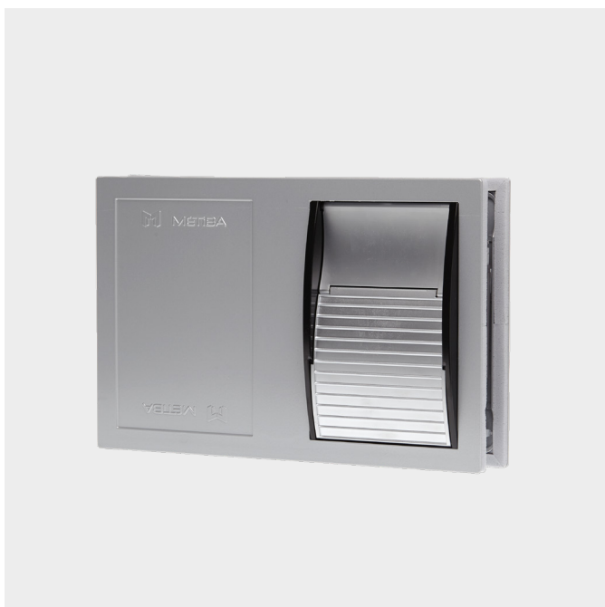
Pedal in Ausgangsstellung